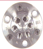
Stator Injektion Valve Bestell Nr. 7010-040