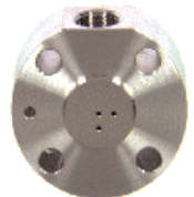
Stator Spülventil Bestell Nr. 810-3097