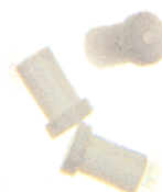
Dichtung Inj.port Bestell Nr. 080-3040