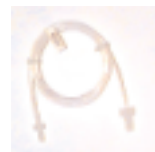
Probenschleife Bestell Nr. 810-3319